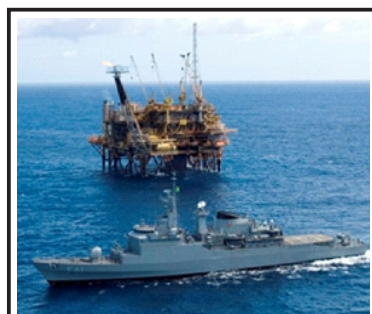
Figura 2 Fragata "Defensora" Realizando patrulha naval

Toda essa nossa riqueza precisa de uma permanente vigilância e controle marítimo. E cabe à Marinha do Brasil a fiscalização do cumprimento das leis e regulamentos na Amazônia Azul. A sua importância estratégica no Atlântico Sul e o direito