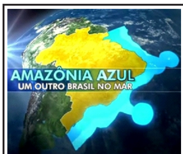
Figura 1 Ilustração da Amazônia Azul

Os limites das Águas Jurisdicionais Brasileiras nos garantem direitos econômicos, porém explicitam a séria contrapartida na assunção de deveres de ordem política, militar, ambiental e de segurança pública sobre a referida área. É imprescindível a ação de presença dos meios navais, como mostrada na Figura 2, para reprimir os crimes nacionais e transnacionais na Amazônia Azul.